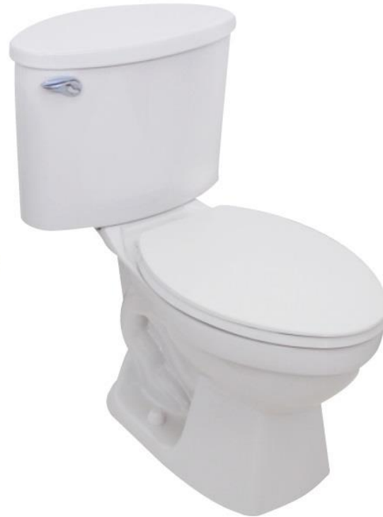
WINNER 4.8 L.