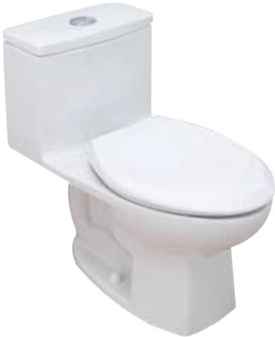
EQUIS 4.8 L