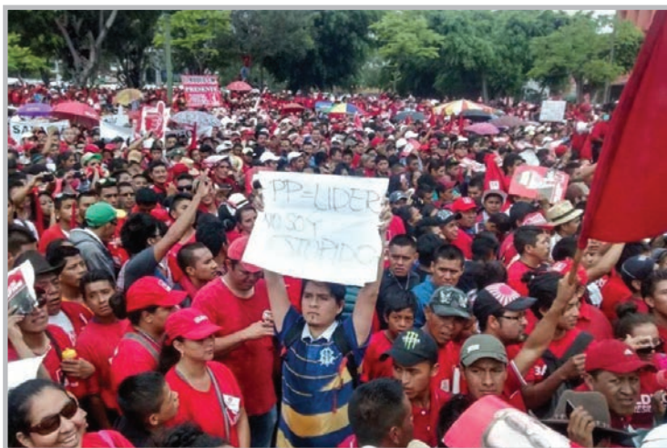
Manifestante en medio de un mitín político del partido Lider.

Esto es mentira. Tiene 47% según la encuesta de su propio estrategia de campaña, Fridel de León, y otra de CID-Gallup, publicadas por su medio aliado, Sonora . Según la encuesta de Borge y Asociados, publicada por ContraPoder y Canal Antigua en junio, tiene 34%. Y está a la baja respecto de las anteriores.