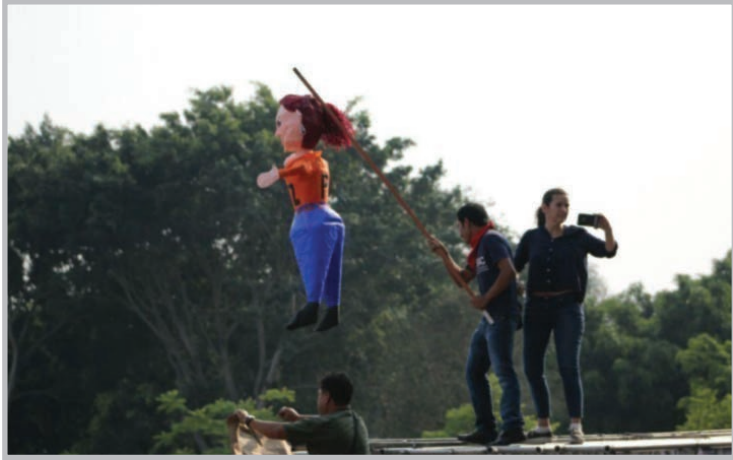
Piñata de Roxana Baldetti.