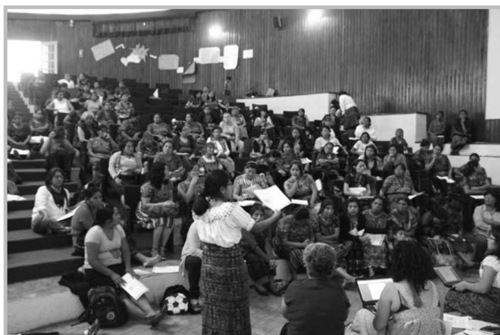
Asamblea Social y Popular. Facebook.

Ahorita quedaría igual que siempre porque no nos beneficiaría en nada.