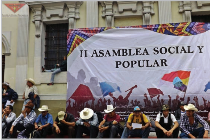
Asamblea Social y Popular. Facebook.