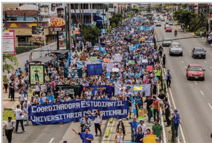
Landivarianos. Facebook. Marcha universitaria en el Paro Nacional del 27 agosto, 2015.

Del espacio resaltaba CEUG, la Coordinadora Estudiantil Universitaria de Guatemala, que por primera vez en la historia unió a estudiantes organizados en espacios disidentes a las redes dominantes de estudiantes de la USAC (USAC es Pueblo) 62 con segmentos de las más importantes universidades privadas del país: la Universidad Rafael Landívar (jesuita), la Universidad del Valle, la Francisco Marroquín (libertaria/neoliberal) y por un tiempo la Universidad del Istmo (Opus Dei). En los meses que siguieron, CEUG se constituyó como el actor más legítimo.