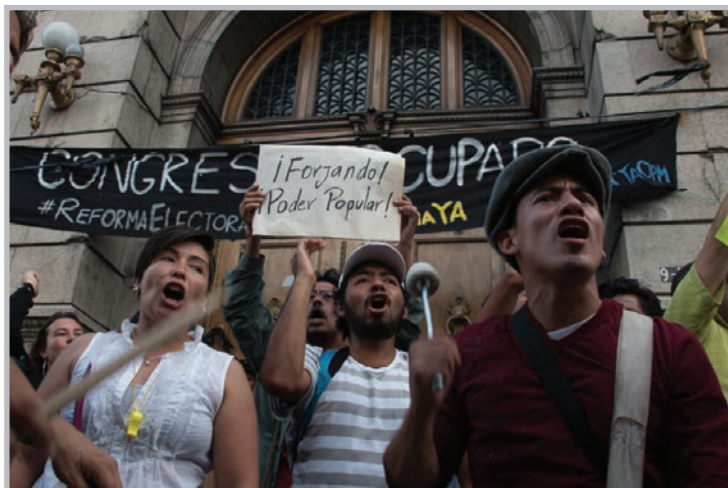
Batucada del Pueblo.

país. Parece una labor imposible transformar esta compleja realidad, pero nos incentivan, por sobre todo, las expresiones de sensibilidad humana que pudimos percibir entre las y los ciudadanos que convergieron en la Plaza y los diferentes escenarios de protesta, como también la permanencia de la participación en el marco de la protesta pacífica, en cada jornada, de principio a fin: personas de distintas condiciones sociales compartiendo juntos, muestras de solidaridad para agentes de la policía como bebidas, comida y resguardo de la lluvia, distintas expresiones artísticas en pintura, música e incluso, arte dramático; participación activa y entusiasta de personas de distintas edades. ¡En fin! Muchas expresiones que habían permanecido inhibidas por el silencio y el miedo, herencia y resultado de un pasado y presente violentos, que hoy se liberan de a poco y que esperamos que continúen fluyendo como una manera de curarnos colectivamente, del despojo y el abuso al que hemos estado expuestos durante tanto tiempo.