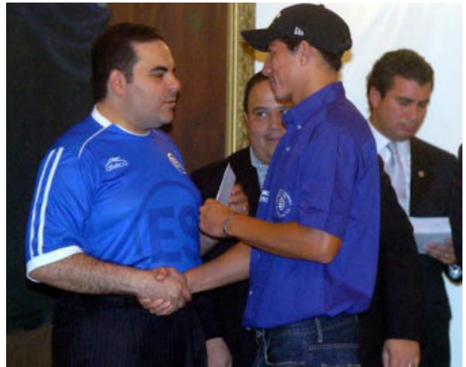
Elías Antonio Saca entregando premio a Alfredo Pacheco, al fondo Rodrigo Calvo.

derechos televisivos y que hoy guarda prisión en los Estados Unidos por su presunta participación en el escándalo “FIFAgate”. Sin embargo, en el país, en ninguno de los casos es fácil hallar una declaración o denuncia sobre estos hechos por parte del entonces presidente de la República. Lo que sí hizo Saca fue aprovechar la popularidad del fútbol y ofrecer $5,000 por gol a los seleccionados masculinos durante la eliminatoria mundialista. Al principio, el reconocimiento monetario se entregó a cada anotador, pero luego fueron repartidos a todo el plantel. Saca decía: “Es un incentivo por el entusiasmo que genera en el país el fútbol”. Sin embargo, no se supo ni la procedencia de los fondos, ni tampoco políticas sostenibles con relación al fútbol.