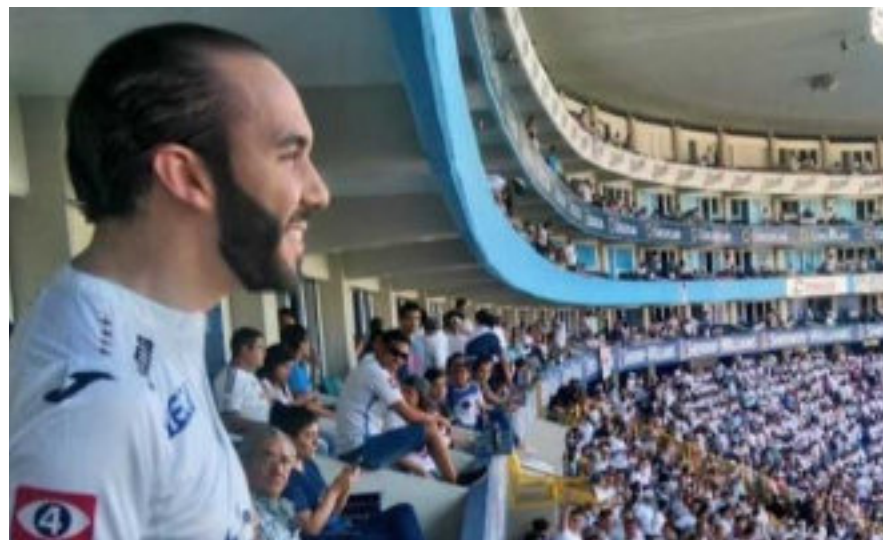
Nayib Bukele en el Estadio Cuscatlán con la camisa del Alianza F.C.

fútbol han sido un atractivo para los políticos que les permite llegar a posibles electores.